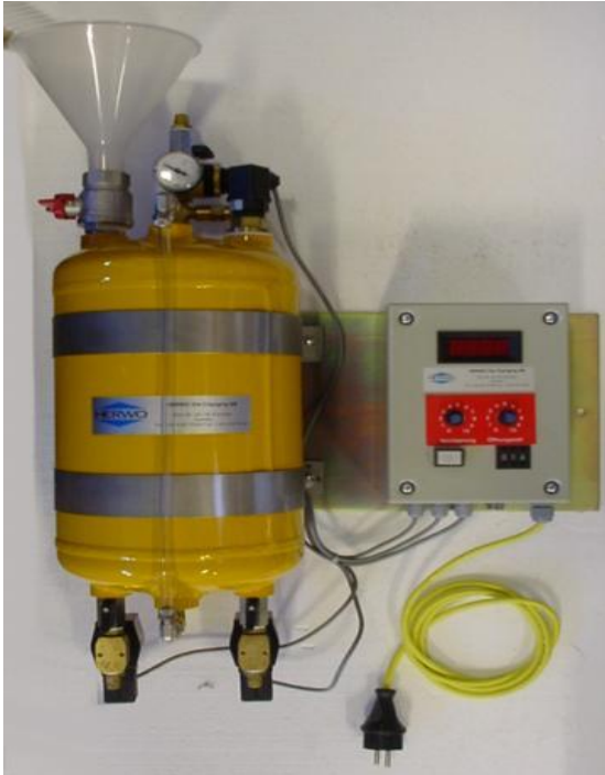
Ovan: Modell DOS 10

Smörjmedelsbehållarens syfte är att dosera ut exakt rätt mängd, vid rätt tillfälle. Herwos utrustningar är anpassade till press verkstaders miljö, och är därför mycket underhållsfria och tåliga.